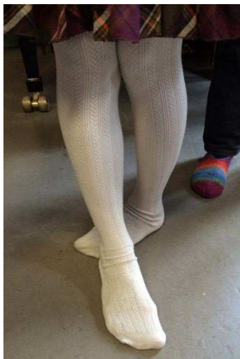
Und wie war nochmal die Fußstellung?