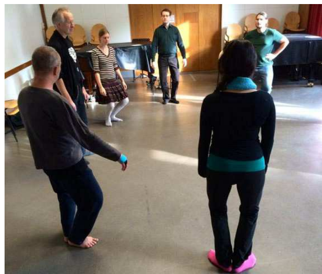
...und schön locker ins Plié!